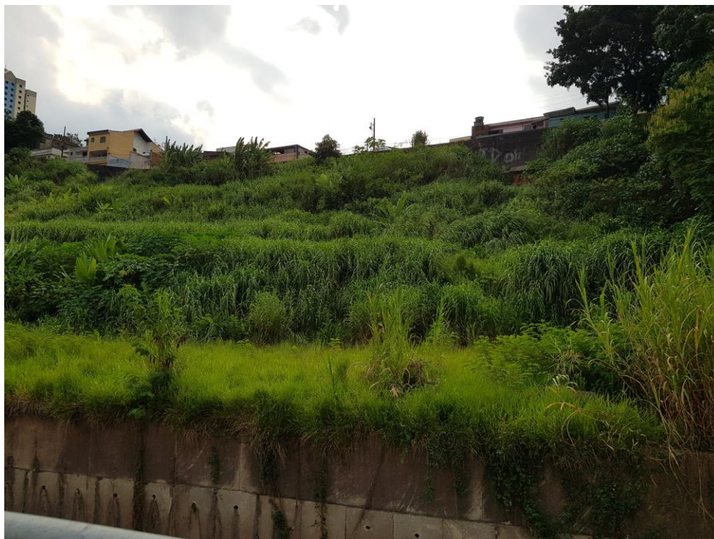
Figura 1- Vista do terreno pela Rua Clemente Argolo.