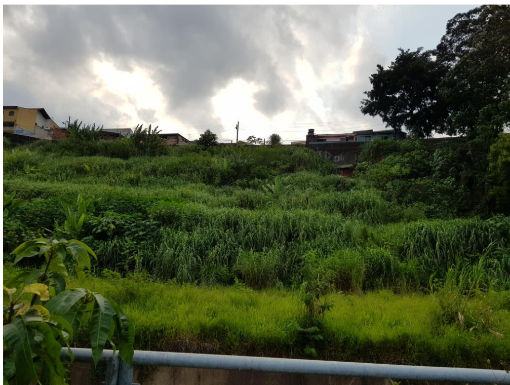
Figura 2 – Vista frontal do terreno.