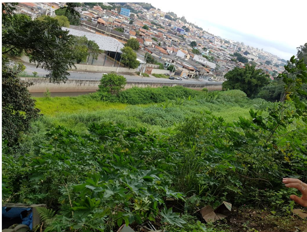
Figura 3- Vista do terreno pela Rua Maria Karachaki Ferraz.