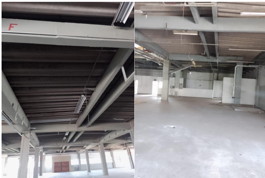
Fig. 02: Telhas quebradas