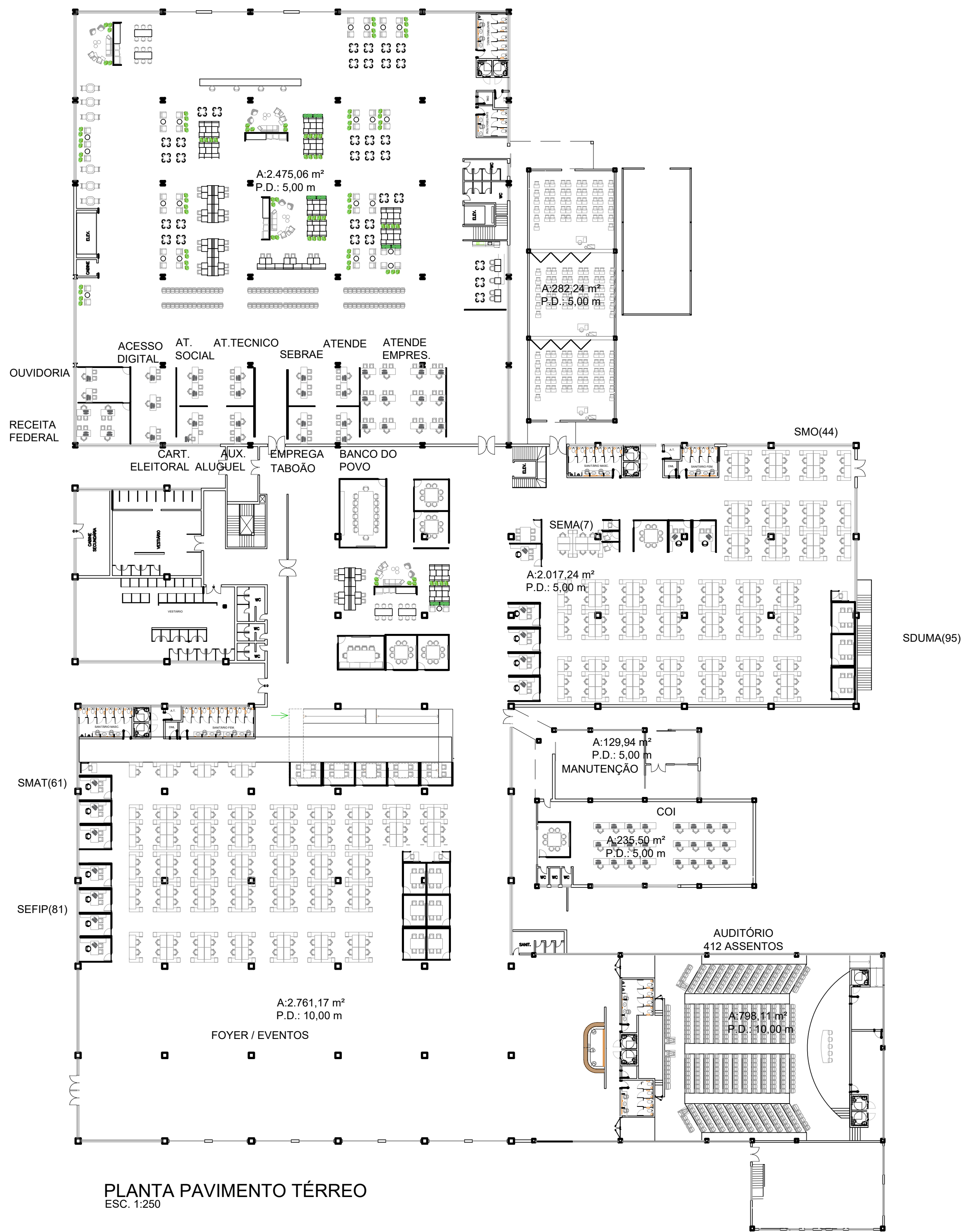
PLANTA PAVIMENTO TÉRREO ESC. 1:250