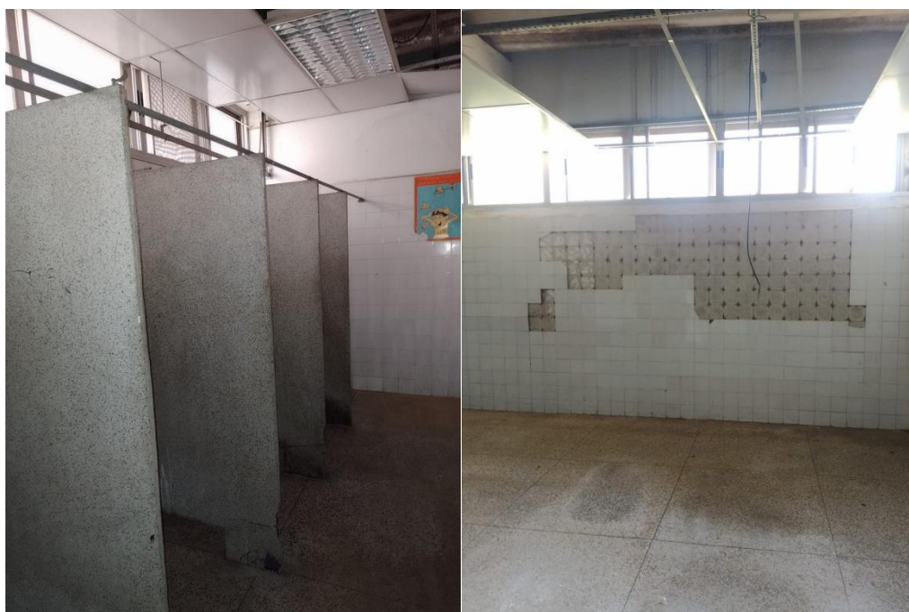
Fig. 05: Banheiro