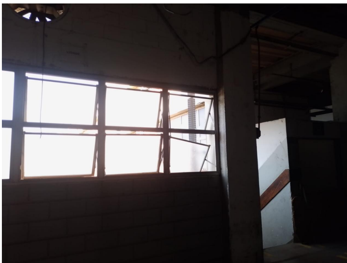
Fig. 07: Esquadrilhas a serem trocadas