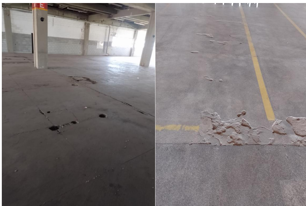
Fig. 03: Piso