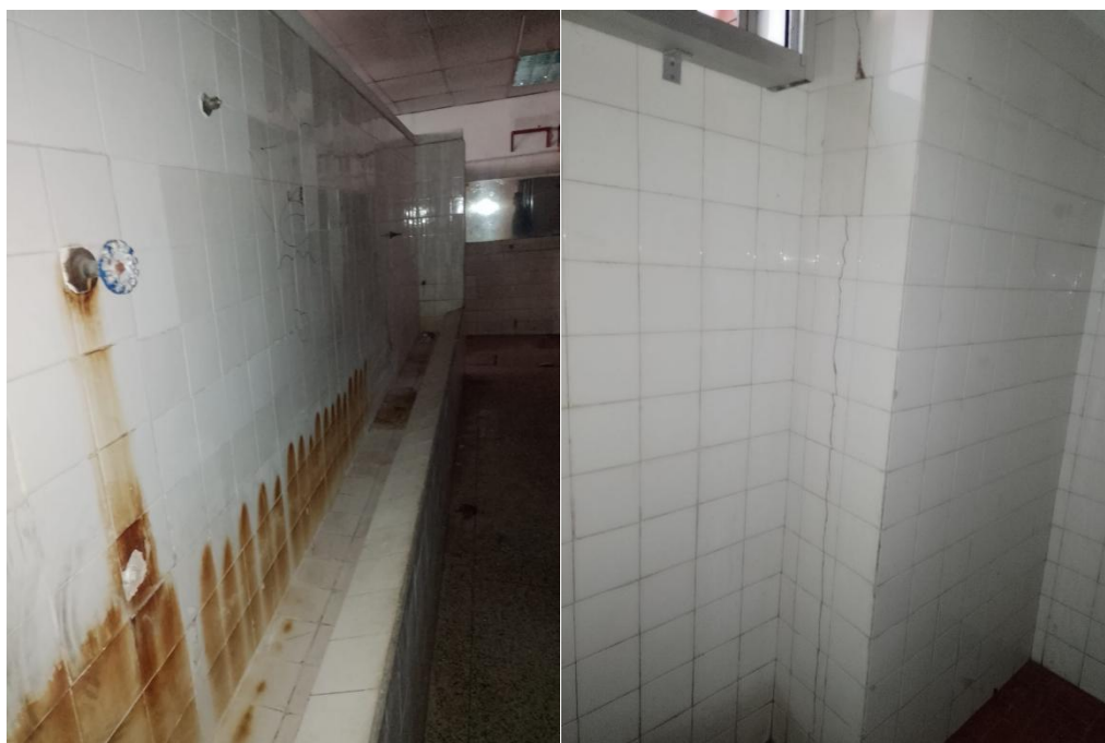
Fig. 04: Banheiros