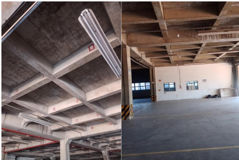
Fig. 01: Teto que receberá limpeza e pintura