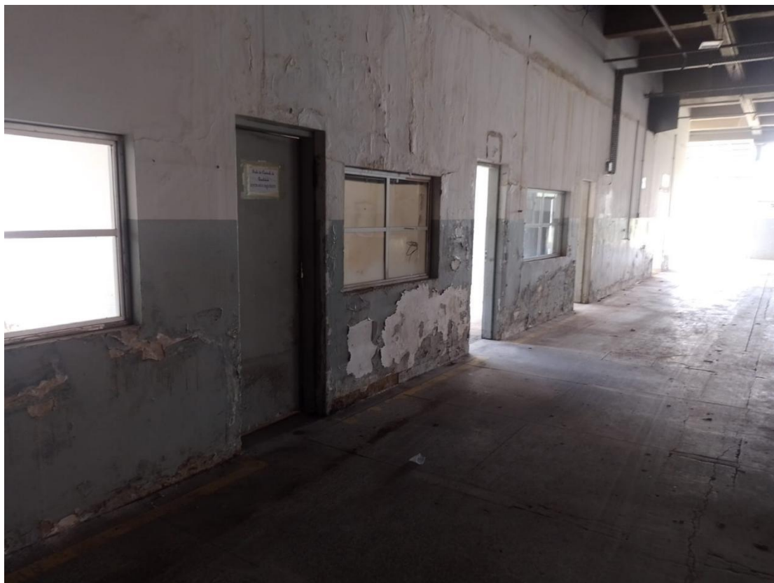
Fig. 08: Alvenaria a serem demolidas