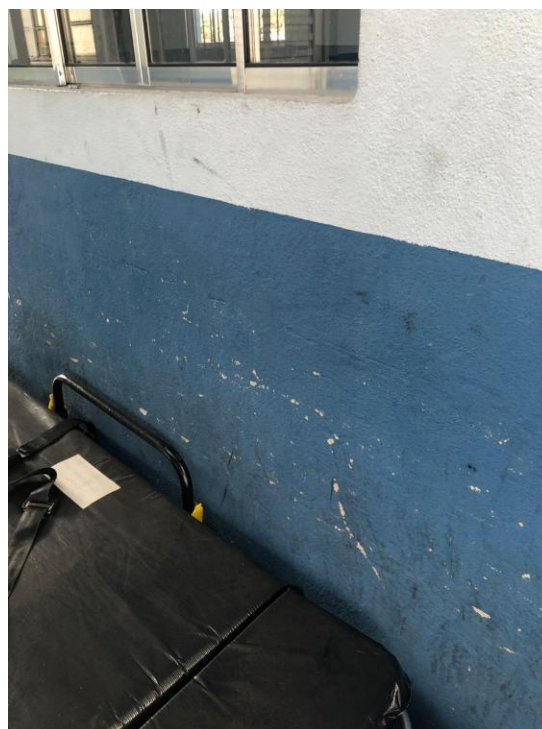
Fig. 10 e Fig.11: Pinturas desgastadas.