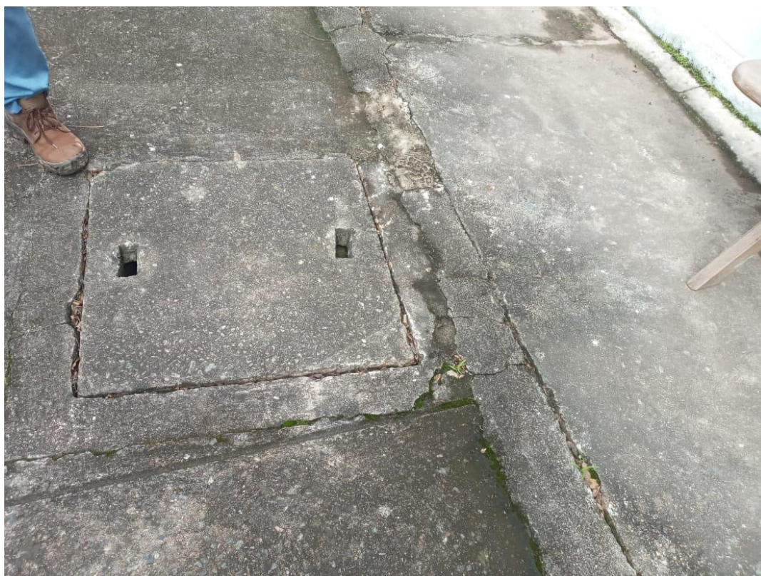
Fig. 06: Caixa de esgoto sem utilização