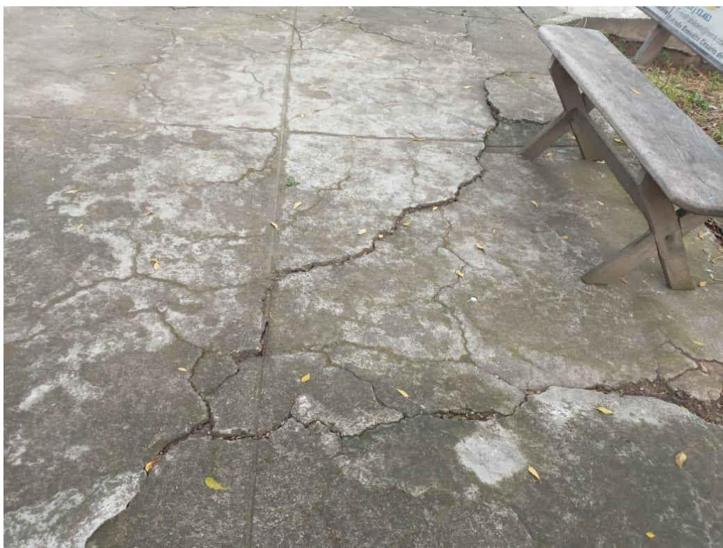
Fig. 02: Piso em frente ao acessos da escada e da saída lateral da UBS, o piso encontra-se rachado e em mau estado de conservação.