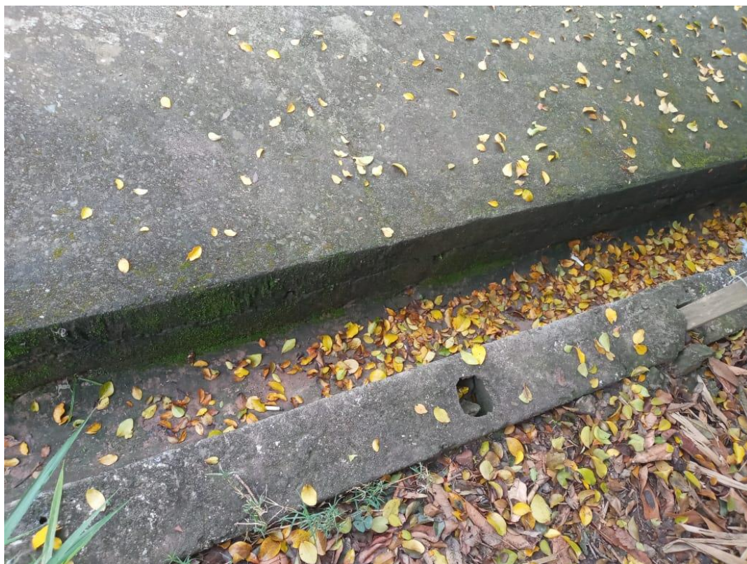
Fig. 05: Canaleta sem gradil nos fundos da UBS