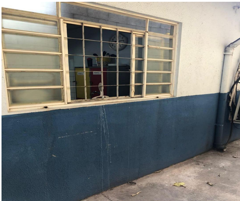
Fig.09: Local destinado a implantação de abrigo de gás.