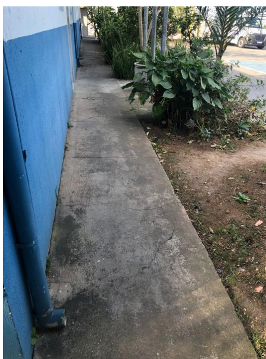
Fig. 03 e Fig. 04: Vista do passeio do entorno da edificação.