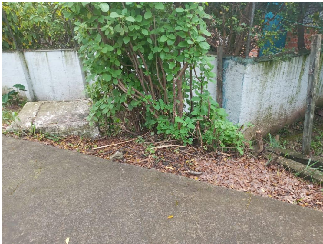
Fig. 07: Caixa de esgoto em uso atualmente.