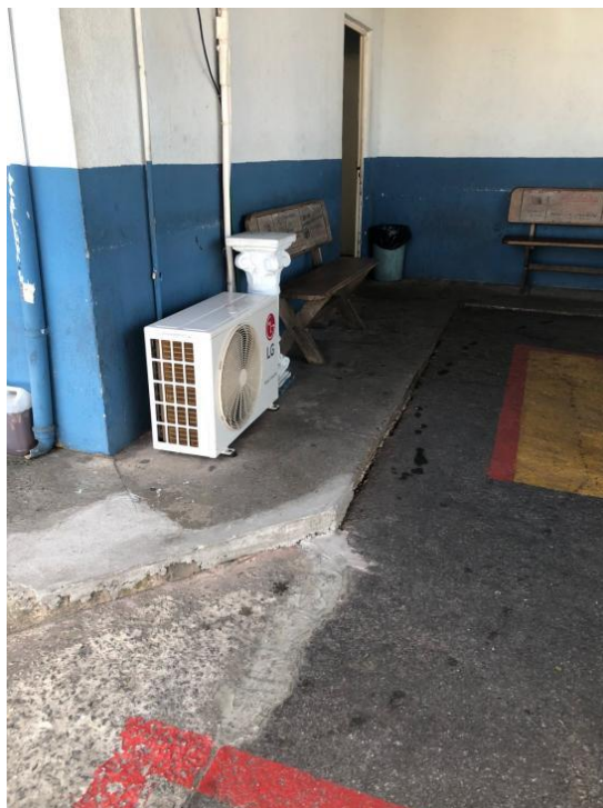
Fig. 05 e Fig.06: Área de acesso aos contribuintes.