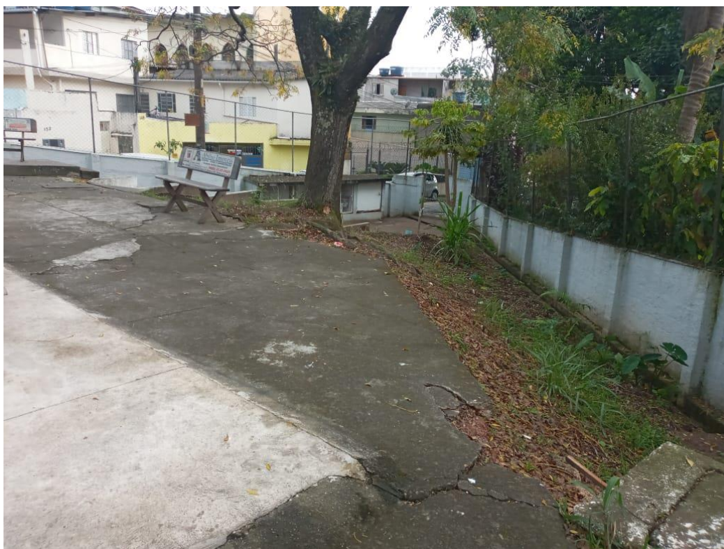
Fig. 03: Piso na lateral da UBS, o piso encontra-se rachado e em mau estado de conservação.