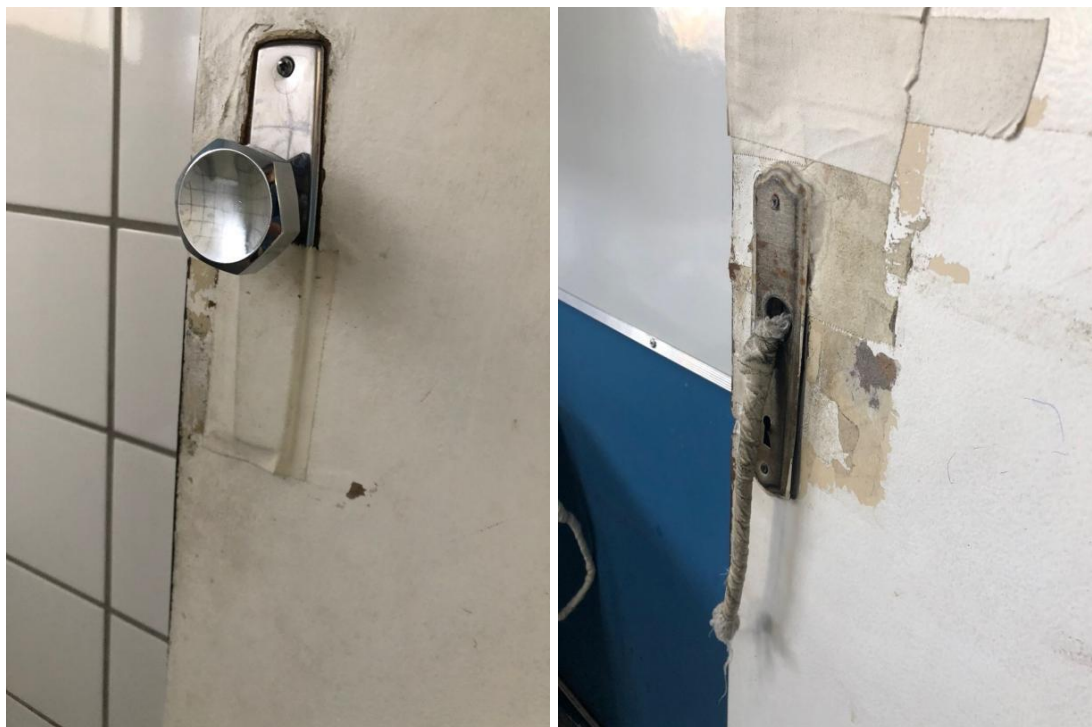
Fig. 12 e Fig.13: Maçanetas/Fechaduras danificadas.