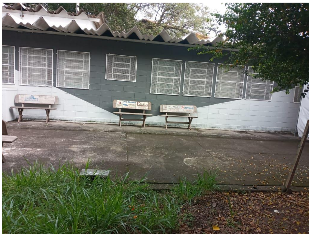
Fig. 08: Espaço onde será implantada a ampliação da UBS