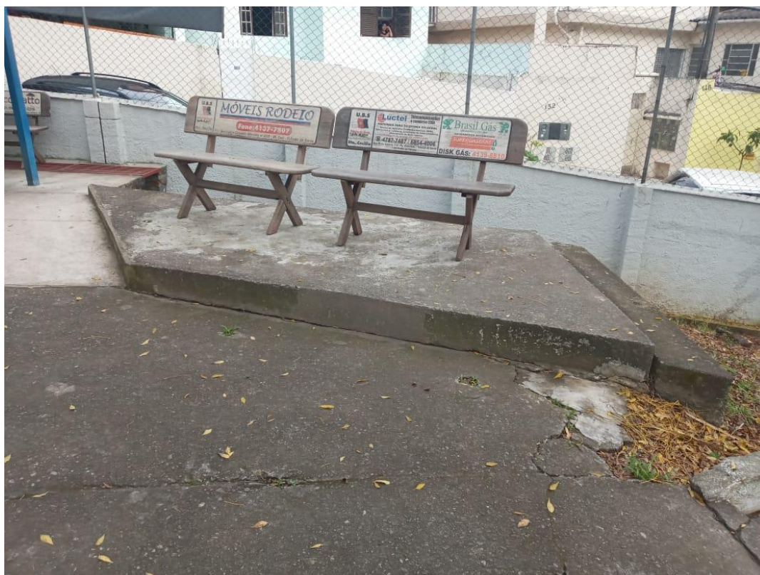
Fig. 04: Desgaste do piso com rachaduras.