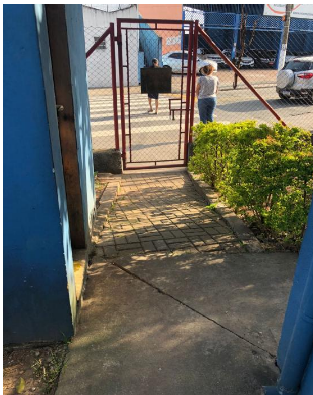
Fig. 02: Entrada de pedestre.