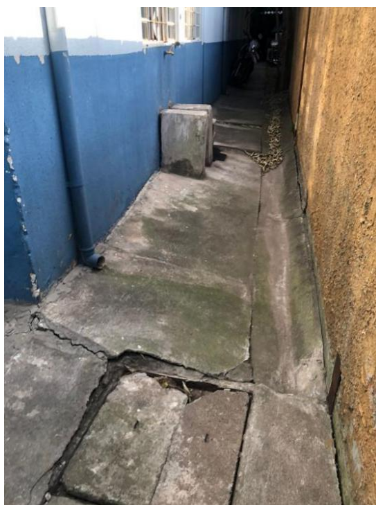
Fig. 07 e Fig.08: Passeio do entorno da edificação.