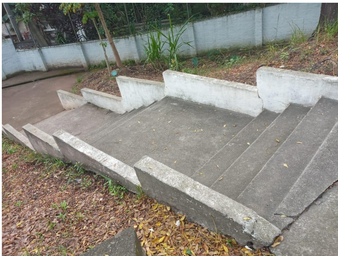
Fig. 01: Acesso pela lateral da UBS via as escadas, as mesmas não possuem corrimão.