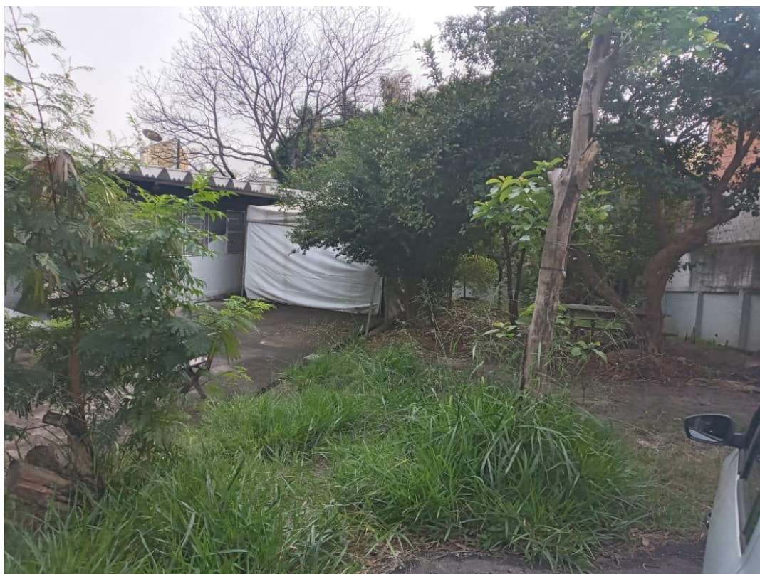
Fig. 10: Área de implantação da ampliação.