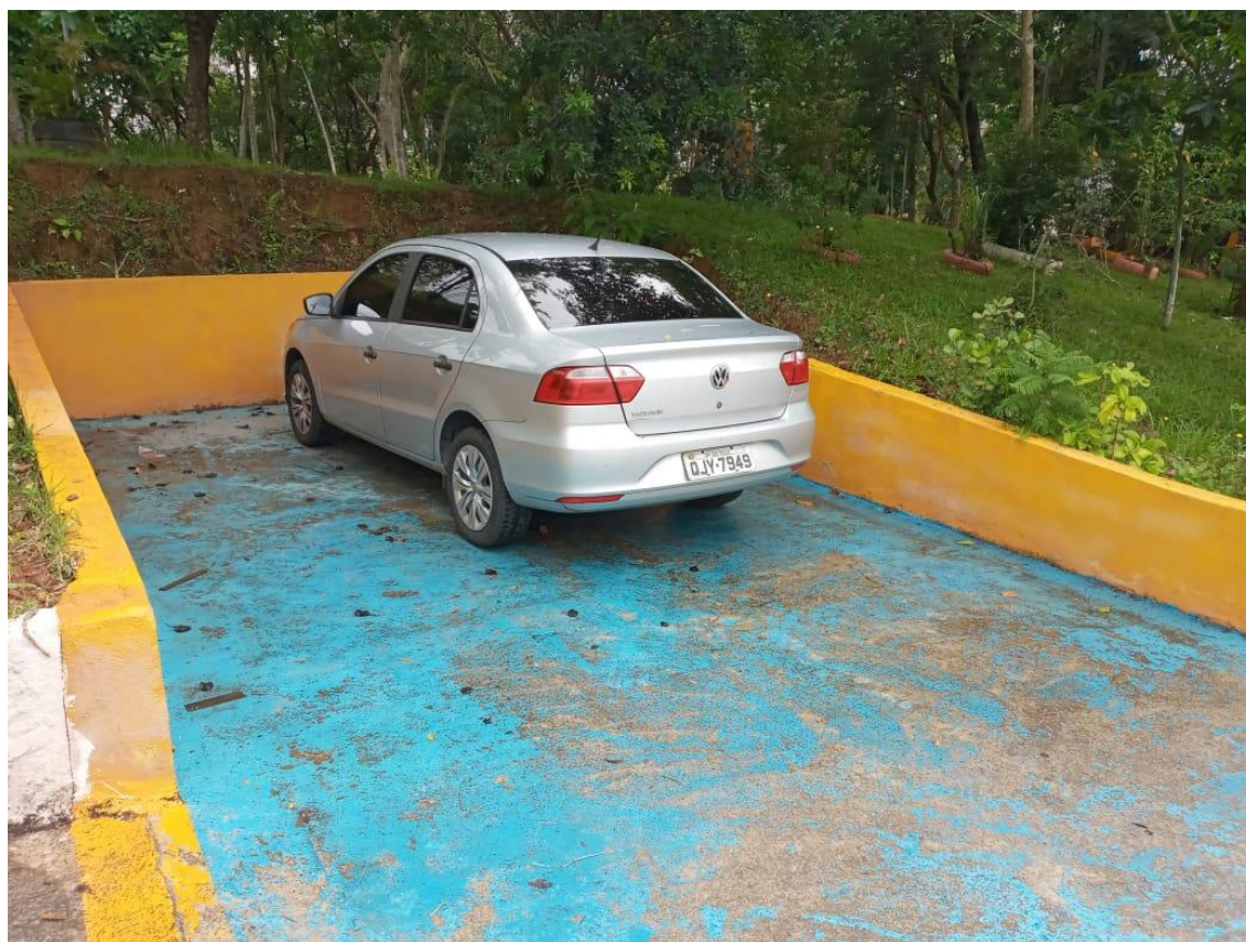
Fig. 01: Local da construção da nova Base da GCM