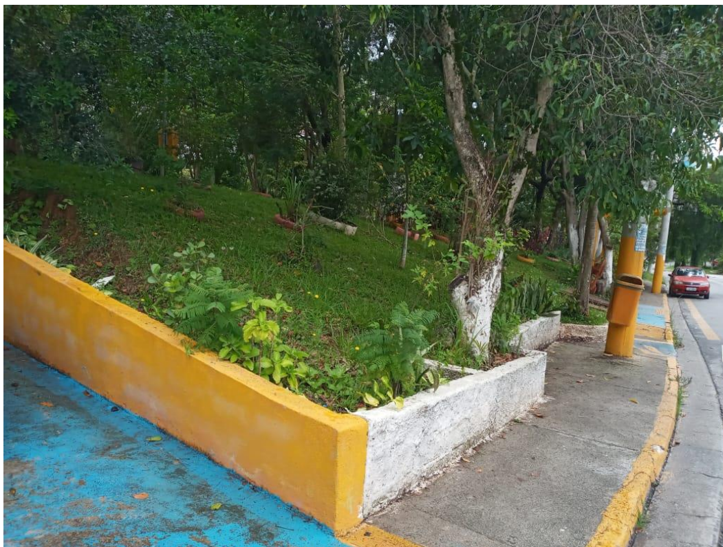
Fig. 02: Local da construção da nova Base da GCM