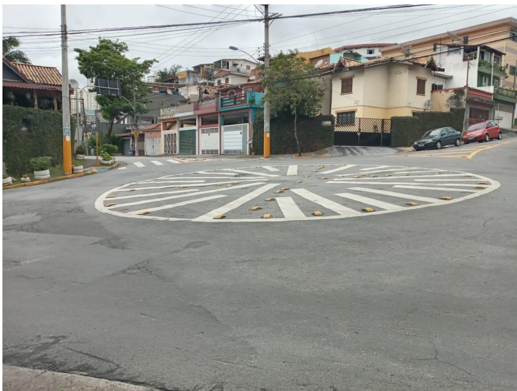
Fig. 01: Rotatoria em frente ao local da construção