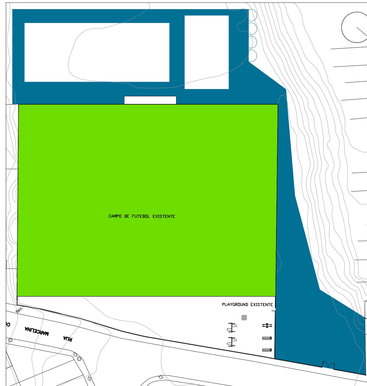
CONSTRUIR ESC. 1/750