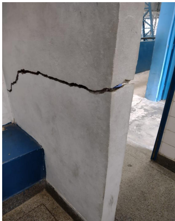
Fig. 09: Parede interna do vestiário