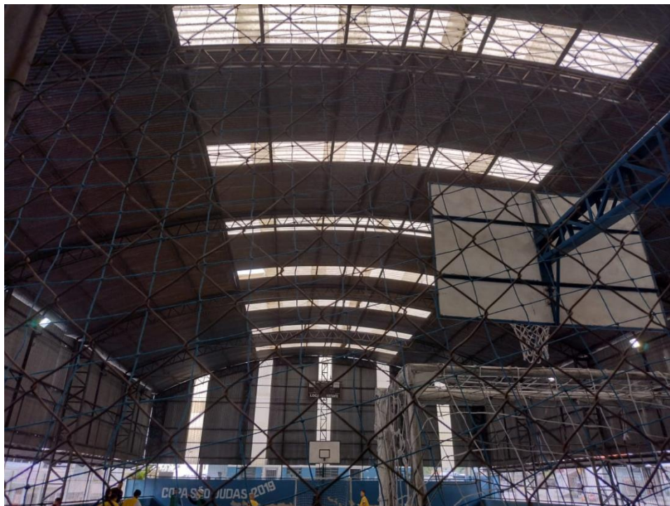
Fig. 01: Telhado e alambrado