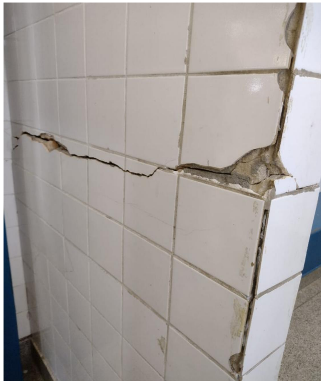
Fig. 08: Parede interna do vestiário