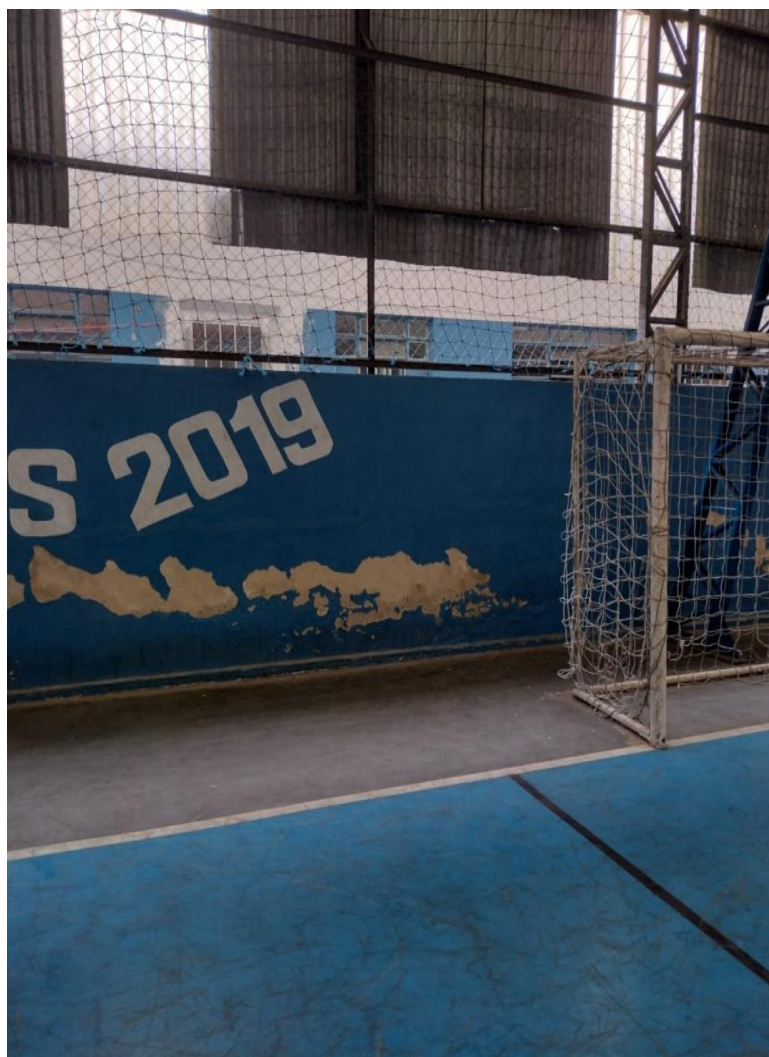
Fig. 05: Telhado