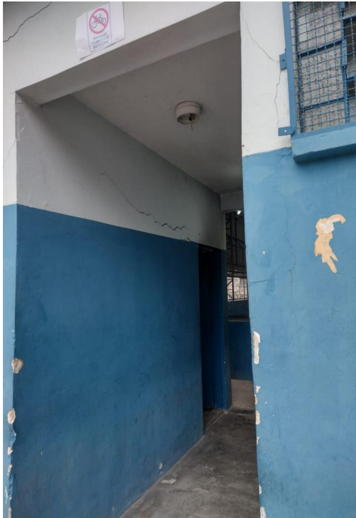
Fig. 02: Parede lado externo do vestiário