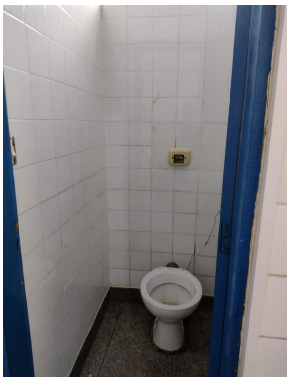
Fig. 10: Banheiro