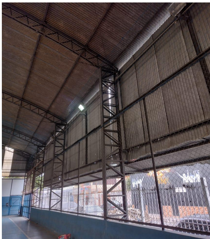
Fig. 04: Estrutura metálica