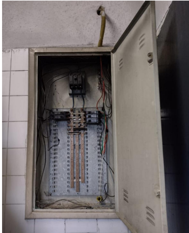
Fig. 07: Quadro de energia